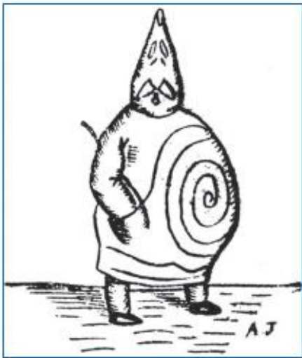
« Véritable portrait de Monsieur Ubu », dessin original d'Alfred Jarry © Roger-Viollet

« - Masque pour le personnage principal, Ubu, lequel masque je pourrais vous procurer au besoin. Et puis je crois que vous vous êtes occupé vous-même de la question des masques. - Adoption d'un seul décor, ou mieux, d'un fond uni, supprimant les levers et baissers de rideau pendant l'acte unique. Un personnage correctement vêtu viendrait, comme dans les guignols, accrocher une pancarte, signifiant le lieu de la scène. »